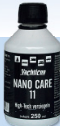
Nano-Care 11 von Yachtigon