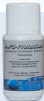
APS 21 CC von Chemicon