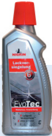
Nigrin EvoTec Lackversiegelung

Die preiswerte Versiegelung aus dem Regal im Baumarkt. Geeignet für neue oder grundgereinigte Lacke. Sie ist shampoofest und waschresistent, aber nicht sehr lang anhaltend.