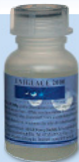
Uniglace 2000 von Foerg

CCC hat Hammerschlagblech mit aktuellen Nano-Produkten behandelt und künstlich belastet. Die Verarbeitung ist bei allen Mitteln ähnlich und bedarf der identischen aufwendigen Vorarbeit. Ein mittlerer Caravan hat im Schnitt 40 Quadratmeter lackierte Flächen. Hinzu kommen die Kunststoffteile, wenn diese auch behandelt werden sollen.