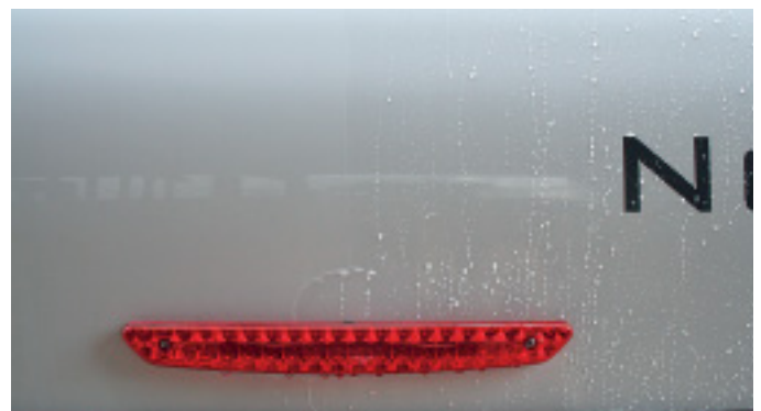
Perleffekt: Auf der APS-beschichteten rechten Seite bildet Wasser Tropfen.

Doch wie bewährt sich die geheime Rezeptur in der Praxis? Für CAMPING CARS & CARAVANS